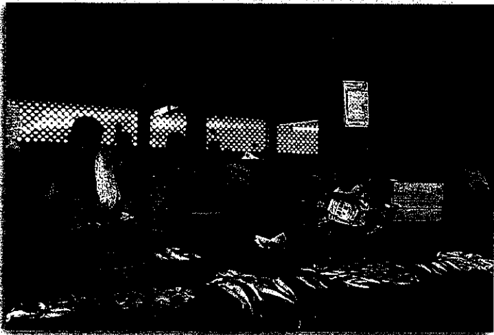
בין מקדשי האתמול לדגים הטריים של היום: ארץ הניגודים

השיטה שהובילה לאירוע אחרון זה, שילוב של חינוך לפוריטניות תוך האשמת הנאנסת באופן כמעט קבוע, שחרור אנסים והטלת עונשים קלים עליהם, הן מכח החוק והן בפועל על ידי בתי המשפט. המחאה נשאה אופי נשי מובהק, תוך קואליציה עם כוחות ליברלים ומתקדמים בניו דלהי ובמימשל כולו, תוך זעקת "לא עוד".